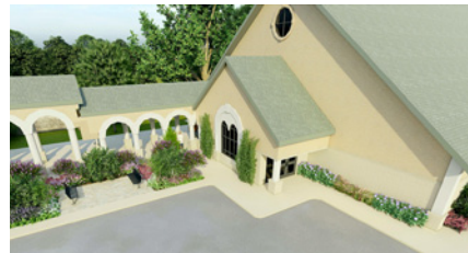
Centro de Vida Familiar propuesto para Christ the King

Un puñado de parroquias que habían planeado campañas independientes más grandes que incluían el esfuerzo diocesano, pero que se detuvieron o cambiaron de rumbo debido a la pandemia, han ayudado a la diócesis a superar aún más la meta de $85 millones. Pero el Obispo José Vásquez se apresura a señalar que los esfuerzos colectivos de todas las personas que contribuyeron a la campaña son los responsables de su éxito.