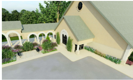
Christ the King's proposed Family Life Center.